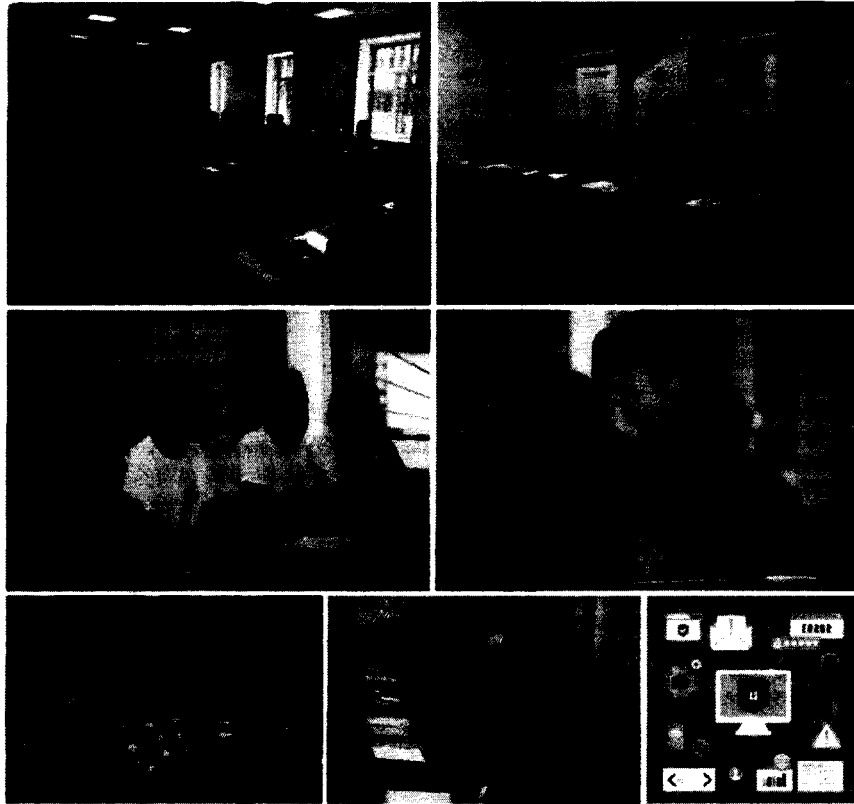
Рисунок 6 – Фоторепортаж открытия первого потока обучения в официальной группе движения "Интернет без угроз" " vk.com/internetithouthreats "

5. Заключительный пресс-релиз с комментариями участников – размещается в день завершения мероприятия или на следующий день.