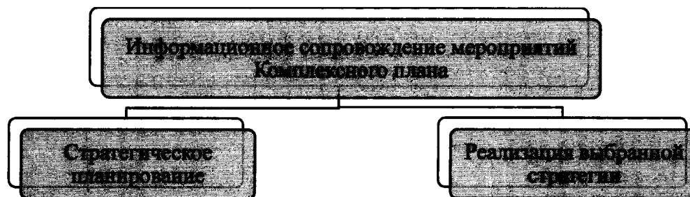
Рисунок 2 – Планирование информационного сопровождения мероприятий Комплексного плана

Основные принципы информационного сопровождения мероприятий Комплексного плана основываются на базовых принципах: